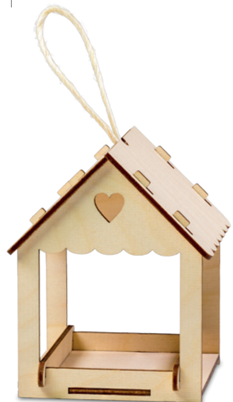
Vogelhäuschen / birdhouse

Bilder und Schriften müssen eingebettet werden Images and writings must be embedded